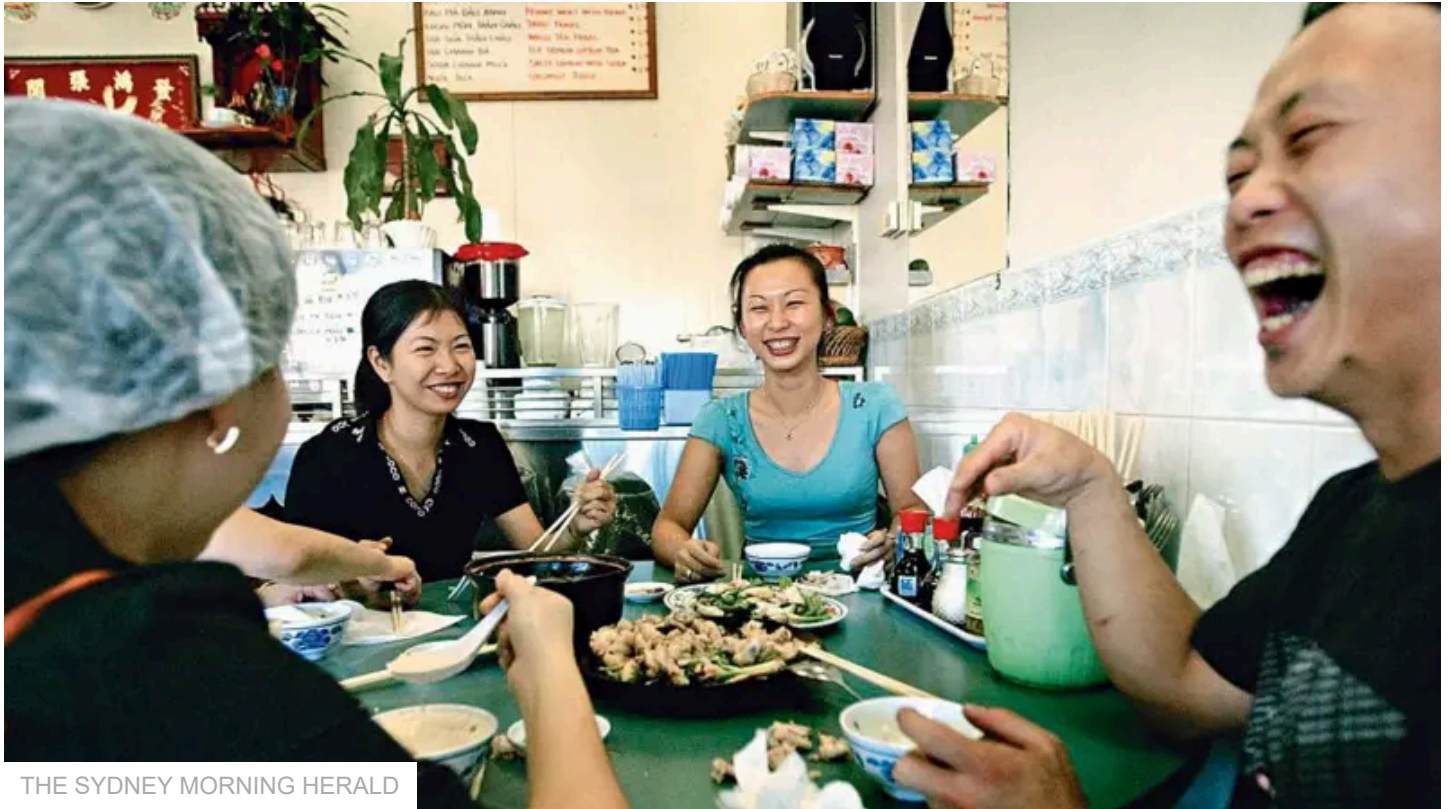
THE SYDNEY MORNING HERALD

Tất cả mọi ý kiến của phía đối lập đều bị Thủ tướng Fraser bác bỏ, ngược lại phe đối lập không cho phép chính phủ nhận thêm nhiều người Việt từ các trại tị nạn.