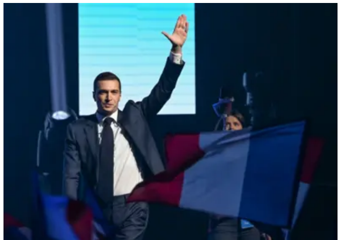
Người có thể trở thành thủ tướng Pháp ở tuổi 28 là ai?