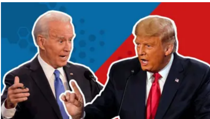
Sáu bang 'dao động' mang tính quyết định cho cuộc bầu cử Mỹ