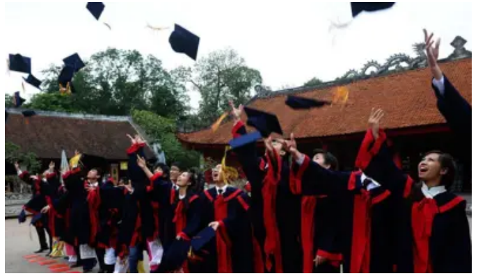
Tự do học thuật ở Việt Nam: khi giáo dục đi liền với chính trị