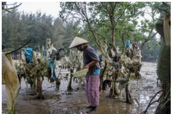
Người Việt Nam trong nhóm 'ăn nhựa' nhiều nhất thế giới